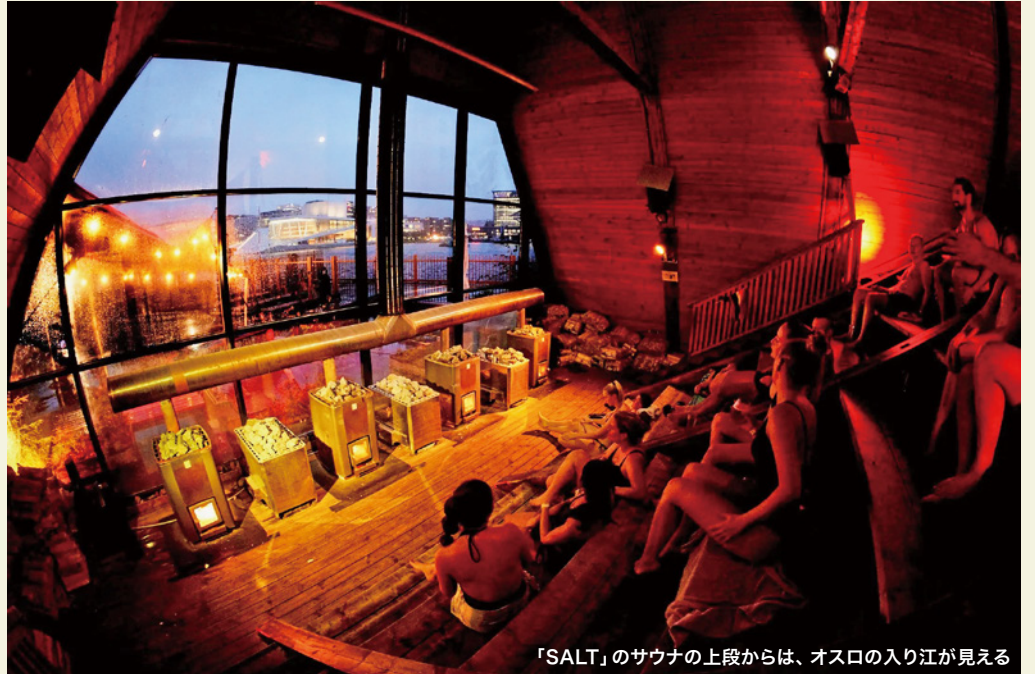
「SALT」のサウナの上段からは、オスロの入り江が見える

北欧ノルウェーならではのサウナスポットで世界中のサウナ愛好家との交流を楽しみ、自由時には観光もできる。ゆったりと価値のある北欧時間を過ごしていただきたい。