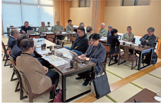
「豊島園 庭の湯」での理事会

例年3月7日に開催している「サウナの日スペシャル企画」の説明があり、例年通り「満37歳のお客様及びそのお連れ様1名ご招待キャンペーン」について協賛店で開催することが了承され、記念タオル10,000枚の制作を進める。また、会員数の推移、養成研修講座受講状況の報告がされた。