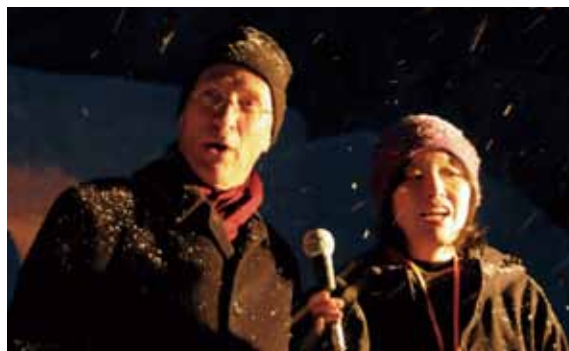
スウェーデン大使 ステファン・ノレン氏と橋本晴子氏