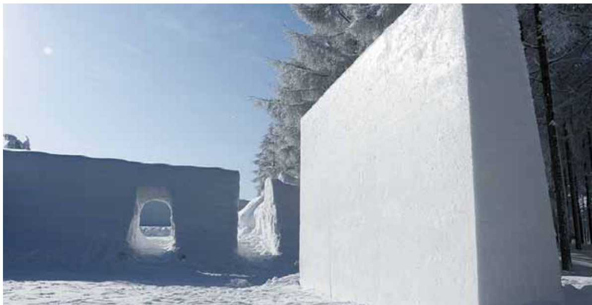
約200名収容のスノーシアターにそびえ立つスノースクリーン

極寒の雪の中でテントサウナを体験するまたとない機会。一人でも多くの方にサウナの魅力を知ってもらいたい。雪山での開催であるため、参加希望者のためのバスツアーも企画されている。協会では「テントサウナinみゆき野映画祭」として今後も推移を報告するが、映画祭の詳細はスノーコレクティブのHPにて確認していただきたい。