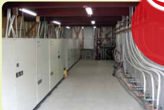
▲ecoマルチ・ヒーポン(SCV-030WW-D×2基、SCV-030WSR-A×2基) 機械室内設置