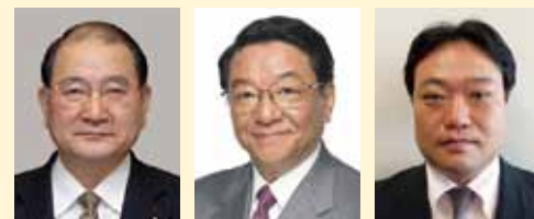
▲左から細川大臣、藤村副大臣、岡本政務官

第2次菅内閣の組閣により、9月17日、細川律夫氏が厚生労働相に就任した。副大臣は藤村修氏と小宮山洋子氏、政務官は小林正夫氏と岡本充巧氏。細川新大臣は先の第一次菅内閣と09年の鳩山内閣で厚生労働副大臣を務めている。大臣就任会見では「少子高齢社会が進み、雇用も大変だ。これらの問題に対応して国民の期待に応えられるようにする」と抱負を語った。なお温浴業界を管轄する健康局は、藤村副大臣と岡本政務官の担当となる。