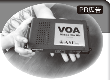
▲最小で大容量のVideo On Air

(株)ASKのオリジナルコンテンツ、アダルトHDプレーヤー「VOA」。ホテルではアダルト放送は映画よりも人気がある不可欠なコンテンツとなっていますが、同社のソフトは特にお客様から根強い人気があります。というのも、一般のCS放送は6年前くらいの作品が主で、月間約60本を月15本入れ替えながら放送するため、同じ作品が3ヶ月ほど流れている場合があります。しかし「VOA」の場合は3年以内の人気作品ばかりで、今、レンタルビデオ店で並んでいるDVD約250作品が入っているといった感じ。しかも同社は全ソフトを編集し、不要な部分は削除しているので見ていてストレスがありません。また、放送内容が1周するのに8日間もかかるので、同じお客様が同じ作品を偶然目にする可能性は限りなく低いと考えられます。さらに最も大きなメリットは部屋数にかかわらず一律月額12,000円という値段設定。衛星放送のような電波障害がなく、アンテナや配線工事不要の上、機器費用・設置費用は無料。今なら一ヶ月無料レンタルも有ります。