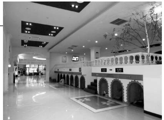
本協会視察団が今回訪れたソウルの最新施設「スパガーデン5」

て適応させることを提案します。四つんばいで歩かなければならない状態のトンネル様のものを設置して、虎の歩き方のように四つ足で歩くのです。これで1日200m歩けば万病によいでしょう。