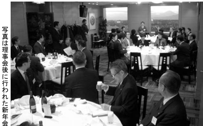
写真は理事会後に行われた新年会

SAUNA・SPA新聞へのご意見・ご感想をお聞かせください。協会ホームページでもご覧になれます。http://www.sauna.or.jp/