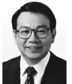
衆議院議員・協会顧問

結びに、引き続きの御指導・御鞭撻をお願い申し上げます。皆様のさらなる御多幸を祈念し、新年の挨拶といたします。