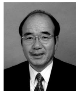
日本サウナ・スパ協会理事 鹿児島大学大学院循環器呼吸器代謝内科教授

「和温療法」を保健医療にすべく鋭意努力中ですが、今後ともご支援をどうぞよろしくお願い申し上げます。