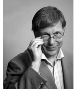
フィンランド大使館報道・文化担当参事官 セッポ・キマネン

2008年の年頭にあたり、日本でサウナ文化を推進する日本サウナ・スパ協会のご成功と、ますますのご発展を心からお祈りいたします。