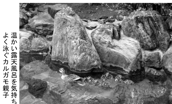
温かい露天風呂を気持ちよく泳ぐカルガモ親子

湯温を通常の40℃から36℃近くに下げる配慮や、お客様からの餌の差し入れなど、温かく見守ってきたかいあって9羽のヒナたちはスクスクと育ち、巣立ちも目前となっている。関係者たちは今、近くの多摩川までカルガ