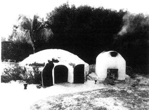
現代のテメスカル(左)と石を焼く炉(右)

テメスカルのある庭の前は白砂の海。海岸にあるシャワーで汗を洗い流します。低温のパーニアに似ている気がします。