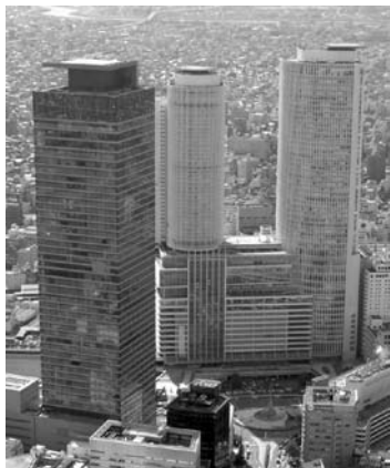
ミッドランドスクエア(左)と総会会場となるマリオットアソシアホテル(右)