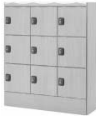
木目調ロッカー、シューズボックス