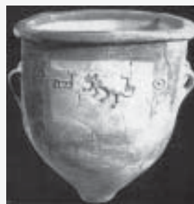
（左）前18世紀の浴槽。明褐色土 高93cm x 幅81cm（右）クレタ島クノッソス宮殿にあるテラコッタ製浴槽。現代の浴槽とほとんど変わらない。

にこのような大物を作る技術を蓄積していたわけですから、召使いが壺に入れた水なり湯を運んで汲み入れ、ご主人様を使い終わった後は残り水を汲み出して捨てたのでしょう。一般庶民とは無縁のもので、人々は川や池で行水をしていたのだと思います。クレタ島のモダンバスタブは、写真で見る限り現代の磁器製高級バスタブと比べても、どちらが3700年も昔のものか区別がつかません。案外、現代のものが昔のものからデザインを盗んでいるのかもしれない。