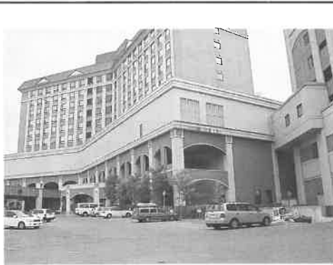
東北・全国総会の舞台となった岩手県栗石町の「鶯宿温泉」の温泉口にある「ホテル森の風鶯宿」の外観。

皆さまとともに、ちょっと先のことですが、この十四日に国の無形文化財で伝統行事のチャグチャグ馬コという行事も盛岡で開催されますので、ぜひご覧になっていただければと思います。終わりに日本サウナ協会