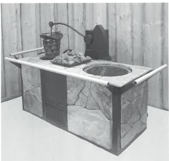
「ヨーロッパの最新温浴施設情報」「デラックス銭湯開業案内」、「サウナと温浴設備」等の資料を用意しております。

ストーブで熱せられた石が自動的に水槽へ運ばれ蒸気を発生させます。 「リョウリュウ」とマイナスイオンが楽しめる最新のサウナです。