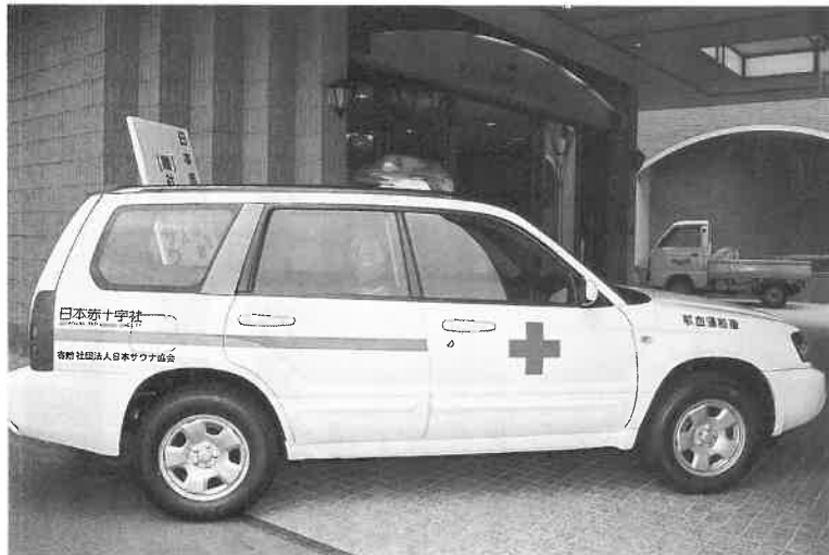
ホテル玄関に展示された血液運搬車