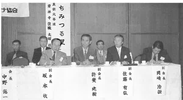
協会の部会長が事業報告