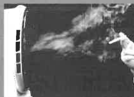
整流エアカーテン

水を使用しない独自の消煙機構。ダブルスライ ス方式で、煙灰をサッと処理。灰皿が熱えるこ とがなく、清掃を済ませに持ちます。取替簡単 が大きく、保守の手間が省かれます。