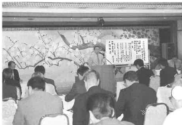
1泊2日の日程で総会

関西支部は「平成十四年度定例総会」を一泊二日の日程で、四国の「金比羅温泉・紅梅亭」(香川県琴平町)で開催した。五月二十一日、大阪・難波、神戸・三宮から参加者五十五名が一台のバスで、「一泊総会開催地」へ出発。同日午後二時三十分より「総会」を開会した。