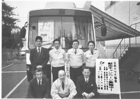
ホテル協会と共催で サウナ協会とホテル協会のスタッフが 開始前の打ち合わせで顔をそろえた。 写真上は都城、下は宮崎の会場で。