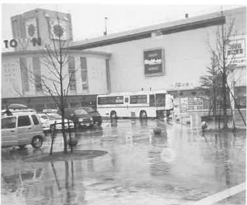
写真上はオリバー本社の駐車場で、下はカラフルタウン前で。