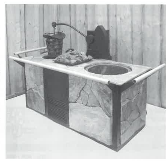
「ヨーロッパの最新温浴施設情報」「デラックス銭湯開業案内」、「サウナと温浴設備」等の資料を用意しております。

逆転の発想! ストープで熱せられた石が自動的に水槽へ運ばれ蒸気を発生させます。「リョウリュウ」とマイナスイオンが楽しめる最新のサウナです。