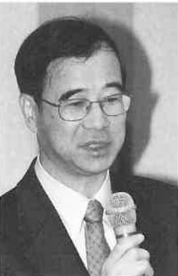
竹中部長より説明

次に機器の改善による省エネについては、まず機器の改善に対する考え方の基準を設定します。例えば「費用は年