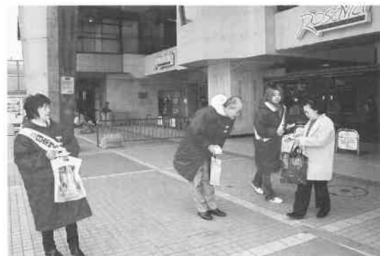
阪急・茨木駅前のターミナルで