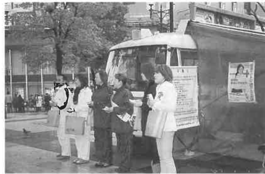
大阪・ミナミのターミナルなんばで

3月はサウナ管理士、健康士の新規生が集中講義と、資格更新の講習会が全国を縦断して実施される。11日に東京会場「スクワール麹町」(千代田区麹町)で健康士の講習会が開催され、これをスタートに、14日札幌、17日大阪、続いて19日愛知、26日小倉、27日福岡で終了となる。管理士は18日に大阪で開催。