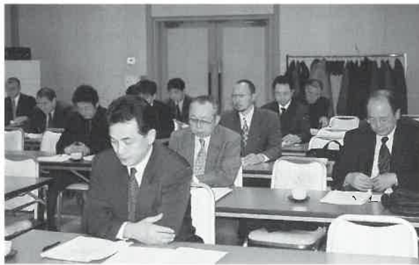
予算総会で審議が行われる

事業方針を述べた。次いで 「同収支予算案」について 説明された。(2月号参照) 以上、二件の議案は原案 どおり承認さ