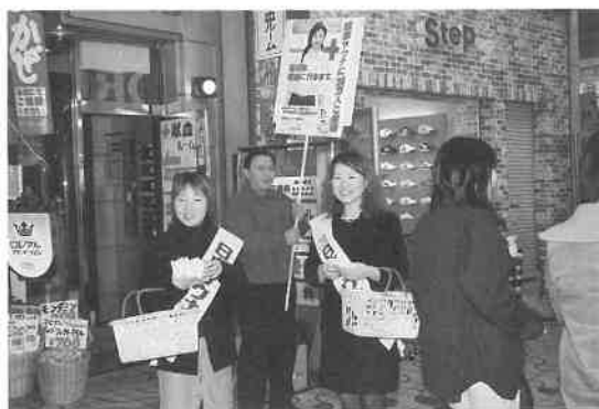
姫路No.1のみゆき通り商店街で