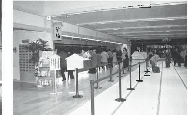
一歩店内に入ればそこは畳敷きの大広間

東京臨海副都心・青海地区(江東区)は、お台場を中心に近未来都市を思わせる光景が広がる。そうした一角に、江戸文化をモチーフとした日本最大級の日帰り温泉テーマパーク、「大江戸温泉物語」(社名同)がこの三月一日にオープン。開業前から随分と話題になり、初日から千客万来のにぎわいが続き、同日現在で入場者は早くも四万人を超えた。一日平均四千人になる。スタッフからは接客に「お客様の居場所を確保するのに精一杯」といった状態だった。 関・総支配人は「当初のつもりでは、ウィークデーで一日二千五百人くらい、土日で五千人くらいの入場者を予想していたが、この調子だと、これから旅行社の団体なども加わるので、年間で百五十万人に達するのではないかと、という、活気づいたスタートだった。」