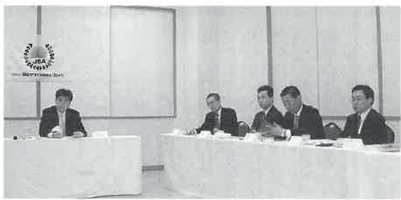
活発に全国総会準備委員会

会場は「銀河リゾート・ホテル森の風」(岩手県 雫石町) ホスト・東北支部が着々と準備を進める!