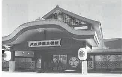
江戸の「湯屋」の構え