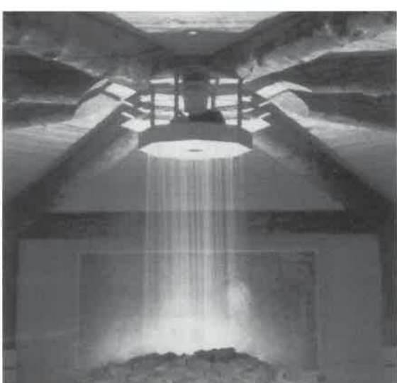
「ヨーロッパの最新温浴施設情報」「デラックス銭湯開業案内」、「サウナと温浴設備」等の資料を用意しております。

サウナストーブの上に仕掛けられた器具から数分毎に雨のように水が落ち、乾燥したサウナ室に「心地よい熱気と蒸気」(リョウリュウ)を発生します。