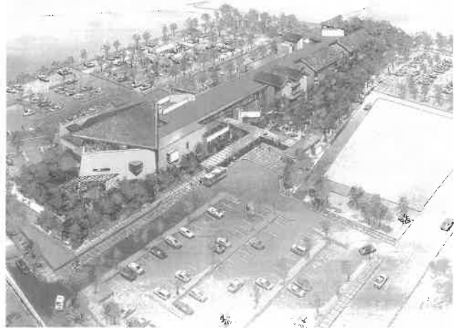
長久手温泉の完成予想図。右上の建物が福祉の家、左の三角屋根のある建物が温浴施設