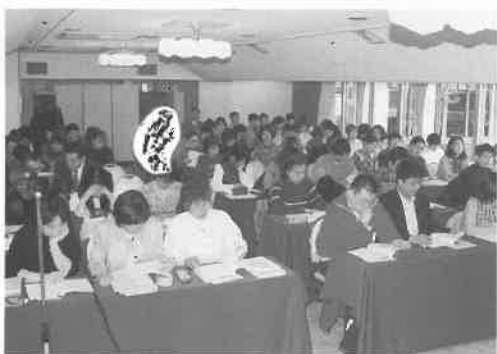
平成13年度の健康士集中講義