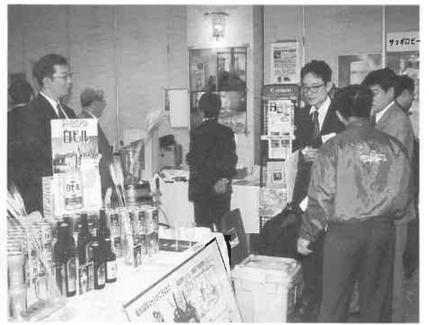
にぎわうサウナ関連商品の展示会場