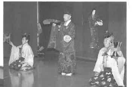
郷土芸能・三河万歳

全国総会に際し次の各社(敬称略、順不同)より協賛を頂きました。お礼申し上げます。 中山産業(株)、アサヒビール(株)、雲海酒造(株)、キリンビール(株)、銀河高原ビール(株)、サッポロビール(株)、沢の鶴(株)、サンポッカサービス(株)、(株)チエリオ中部、大塚ビバレッジ(株)。