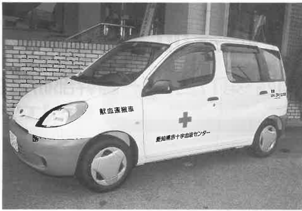
8台目の贈呈になる血液運搬車