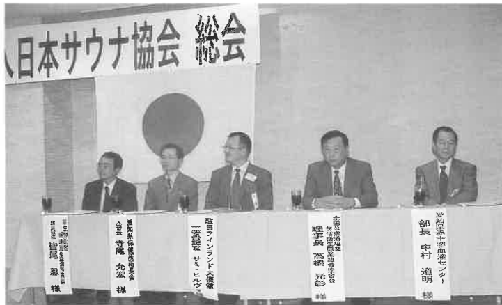
5名の来賓をお迎えして