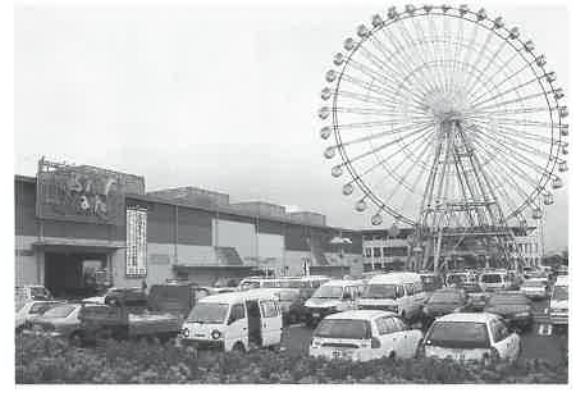
5月16日オープンのフェスティバル・マーケット

全国総会の会場「ホテル明山荘」(愛知県蒲郡市)からゆっくり歩いて十五分ほどのところ、蒲郡東端に位置する「ラグーナ蒲郡」は、三河湾に面した海洋型複合リゾートの総称である。海岸線を埋め立て、開発面積百二十ヘクタールと広大。蒲郡海洋開発(株)(同市海陽町)が開発を進めている。