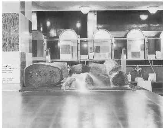
広々としたメンズの大浴場