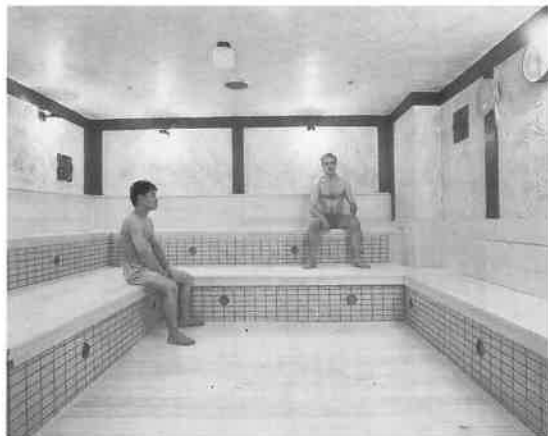
メンズのサウナルーム

東京の副都心・新宿。その中心となるJR新宿駅の東側一帯に広がるビッグな歓楽街が、全国的にもよく知られている「歌舞伎町地区」である。このほど開業から実に十八年ぶりに大規模なリニューアルを断行したカプセルホテル&サウナの「グリーンプラザ新宿」は、同駅東口から東へ歩いて五分ほどのところ、歌舞伎町地区の一角に位置している。