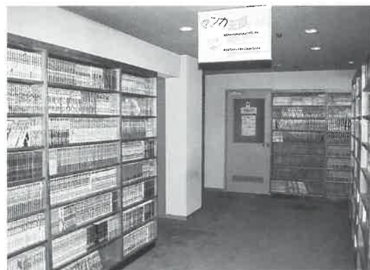
マンガ王国の書棚を埋める7000冊

サウナストレッチ体操は中部地区初登場。「サウナサーキット」の名称で、昨年十二月から始まった。毎週末曜日、サウナ室内で女性のフィットネス・インストラクターが指導に当たっている。