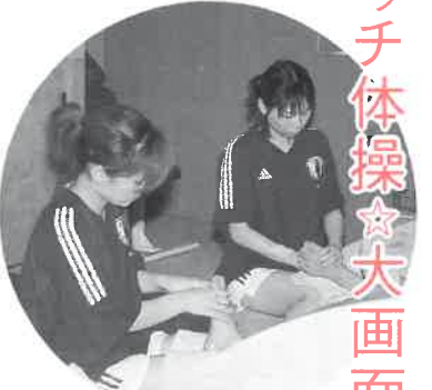
W杯日本選手のユニホーム姿で