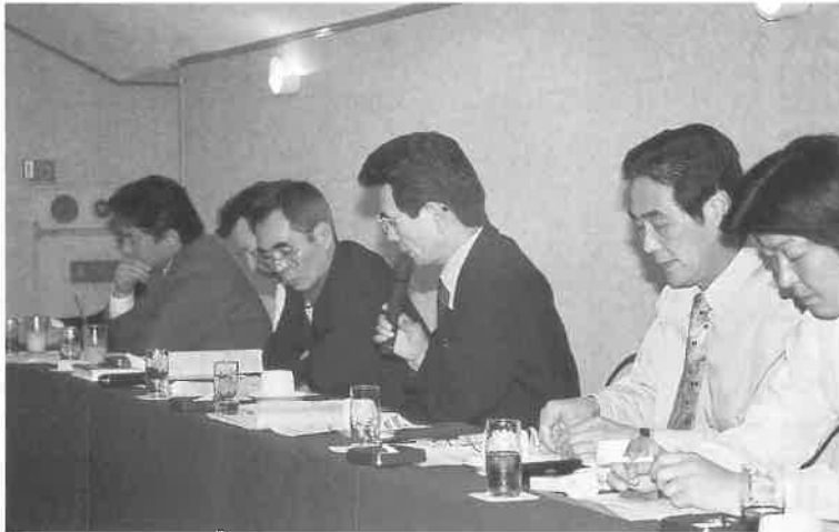
情報交換では「顕在ニーズ」について、各店出席者が自店の状況を説明。この後、質疑が行われた

定例会議は、洪里勝信会長の開会挨拶で始まり、会長は、「ゴールデンウィークの後はお客様がガサツと落ちて、（夏の）ボーナスが出るまで、試行錯誤しながらお客様を入れる努力が必要です。不況もようやく底入れの気配ですが、わが業界にこれが回ってくるのは半年遅れですから、どうか力をたくわえ体勢を整えて、もともとと頑張つ