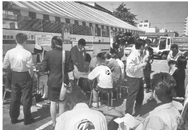
宮崎では(写真上)書架が広がるホテル駐車場の献血会場。(同下)はホテルロビーで行われた献血の状況