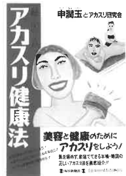
申潤玉 著・毎日新聞社刊 「アカスリ健康法」 正しいアカスリを徹底紹介した必読の健康書です。