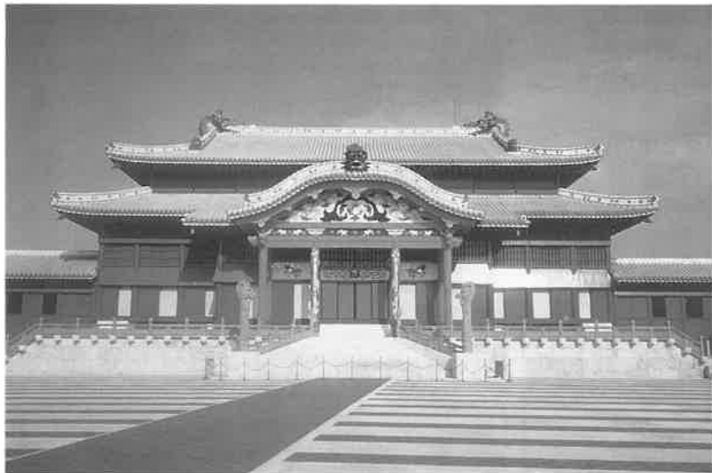
首里城 15世紀に尚巴志が三山を統一して以来、明治政府に明け渡すまで琉球王国の中心として500年近くの間、王統の居城であった城。同時に琉球王国の政治や国家的儀礼および祭祀の中心地だった。

② 北方騎馬民族が南下した朝鮮半島の東南部に位置する慶州の沖合に迂陵(ウルマ)の島があった。陸地から日の出(日神)を拝むことはそのまま、祖霊神を遥拝することであった。こちらは、海を境にしての祭祇行事の場にしてきた。