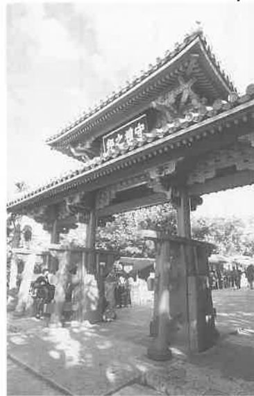
守礼門 1529年創建といわれ中央に「守禮之邦」の扁額が。

みどり映えるこの季節、沖縄 おきなわ の言葉を耳にするつど、日本で唯一の陸上戦の戦火にさらされた地域、その戦火は、戦後まもなく上映された、ユナイテッド映画『1945年の回顧』に、沖縄の沖一面に展開したアメリカ海軍の艦船から撃ち込まれる砲弾の雨、凄まじさは、大阪空襲とは比べものでない。玉砕で沖縄戦の終結が報じられたのは夏至のころだった。