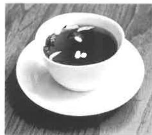
韓国健康茶 貴社の一部に韓国式健康茶コーナーを新設なさってはいかがですか?東京事務所のティールームに、いつでもお立ち寄り下さい。

TEL(052)262-5202 FAX(052)264-0141 TEL(03)3820-4313 FAX(03)3820-3673