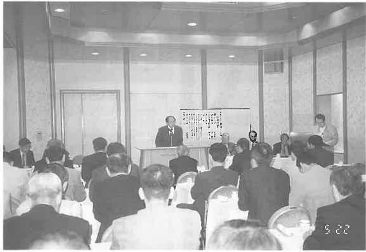
あいさつを述べる洪里会長(中央)