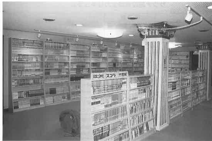
写真上は書棚にぎっしり並び、まんが喫茶コーナー。右はその読書デスク。下はインターネットコーナー。円内はフリードリンクコーナー。