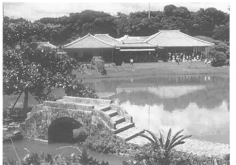
識名園 琉球王家最大の別邸。回遊式庭園で外国使臣の接待などに利用された。中国風あずまの六角堂や石橋があり、随所に琉球独特の工夫が見られる。

まず、ウルマが地名であるところは、次にあげてみる。①岐阜県各務原市鷺沼に宇留間(ウルマ)があった。ここは中仙道 木曾川の渡河地点にあたり、ふるくから人が住み、先土器時代の遺跡と、古墳が数多く、古墳前期の古墳から鏡など出土しており、祖霊神をまつる聖地だったことがうかがわれる。この「うるまの里」は、まさに古墳が多数見られるように、祭祇にかかわり深い渡来人の秦氏が分置された地域であることは、西暦750年にこの地の秦族から高僧 護命がうまれていて、一方、シャーマンとも深いかわりをもつ女祭祇の役目も司どってきた。