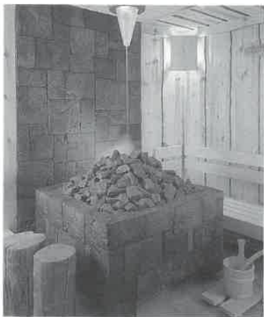
ストーブ上の照明から数分毎に水が落ちるウォーターディスペンサー。

木の部屋・加熱した石・蒸気とマイナスイオン。サウナ二〇〇〇年の伝承科学の謎を究明して完成した「ロッキーサウナ」。気分が良く、健康にも良いマイナスイオンが漂うサウナを提案致します。ガス焚きのため燃費も安く好評です。