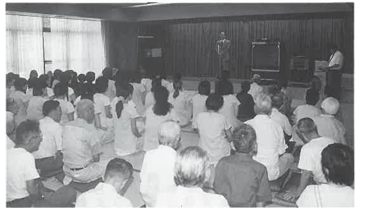
訪問のセレモニーが始まる

同日の昼過ぎ、同院の施設の一つ「寿楽館」の大広間に、大勢のお年寄りが一年ぶりの再会を楽しみに集まり、オペレーターさんらがバスで到着するのを待っていた。「着きました」といふ案内の声とともに、わーっと、にぎやかにオペレーターさんらが姿を見せると、お年寄りたちは拍手と笑顔で歓迎した。「よろ