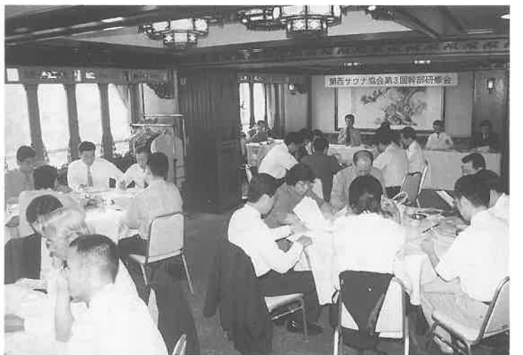
中国料理のテーブルを囲んで熱心に研修

まず、前回の研修会(今年六月二十三日)で「モデル店」となった「健康ランドあま湯ハウス」(兵庫県