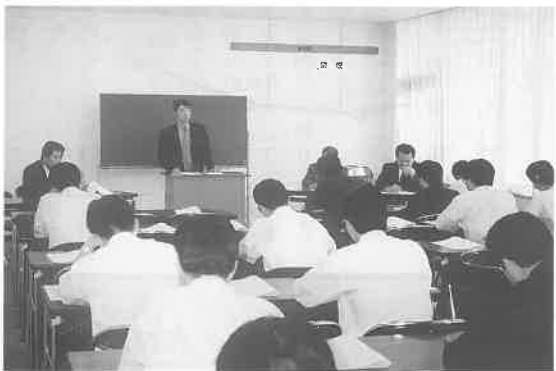
愛知・岡崎会長のあいさつ