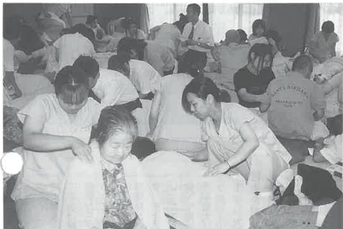
健康サービスの花が咲く

援している。このほど、福岡県赤十字血液センター献血推進部がまとめたキャラバン時の献血実績は、福岡、北九州、佐賀、長崎、佐世保、熊本、大分、宮崎、鹿児島、沖縄の各血液センター合計で、イベント開催時の献血者数は二千百九十人、キャラバン時の献血者数は一万八千八百九十四人にのぼった。