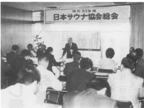
日本サウナ協会と改称した初の総会