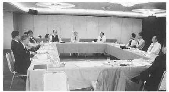
「これだ!」の要望がされ、今後、検討委員会で研究することです。了承された。写真は理事会