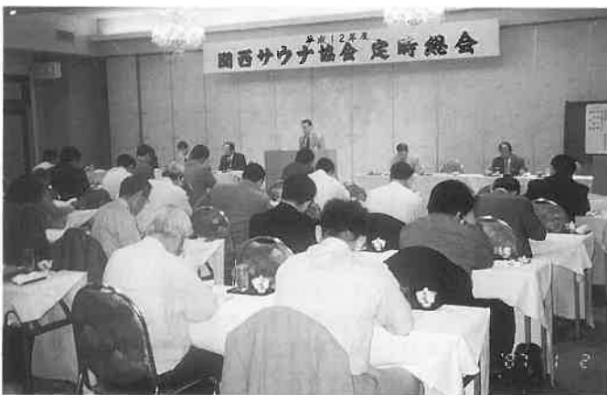
議案はすべて満場一致で承認

ース)で二十八名が参加。観光組は(琵琶湖博物館彦根城・葵・徳川三代展)などを観光。