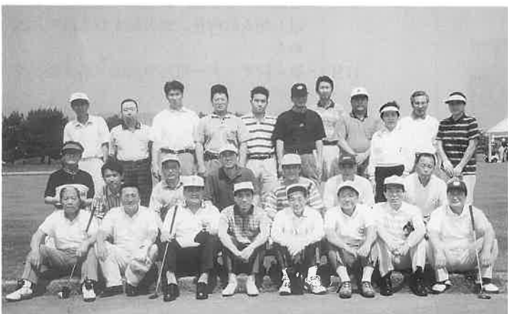
ゴルフコンペに28名が腕を競う