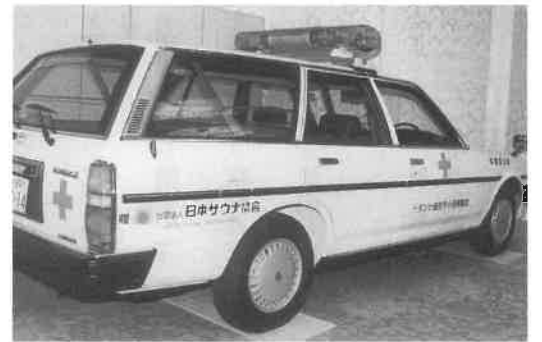
第6回総会(宮崎)で献血関連車両第1号が日赤に寄付された