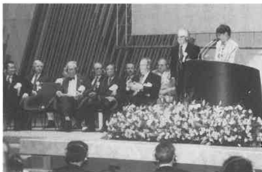
京都で開催された「第10回国際サウナ会議」のオープニング・セレモニー