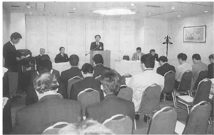
新年度事業計画・予算案など満場一致で承認

委員会を検討し、予定どおり進めています。一人でも多くの方に参加をいたしてください。今一度ご協力をいただき、ぜひ成功するようご協力をお願いしたい」との挨拶があり、次いで来賓