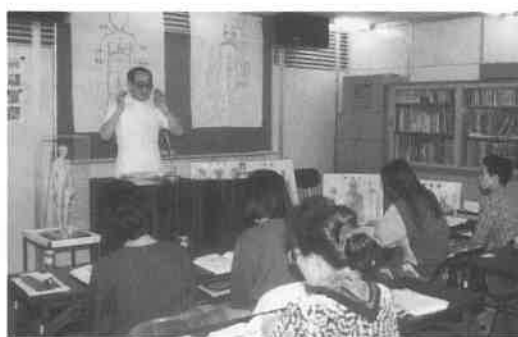
サウナ健康士第1期生の集中講義(平成4年4月東京会場)