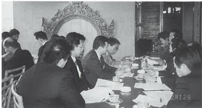
情報交換も活発に行われる

2面・生活関連企業の景気動向調査(平成12年1月~3月期) 4面・レジオネラ属菌防除のための温泉浴槽水等の衛生管理