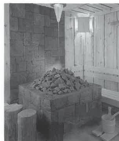
ストーブ上の照明から数分毎に水が落ちるウォーターディスペンサー。

入浴者に対し、浴槽に入る前にあらかじめ身体の汚れを落とすよう、注意書き等で指示をすること。