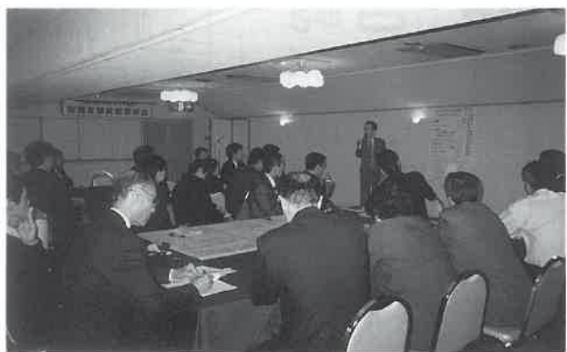
2グループに分かれ対策の立案も

3面・平成11年度サウナ施設管理士集中講義試験問題と解答 4面・平成11年度サウナ健康士集中講義試験問題と解答