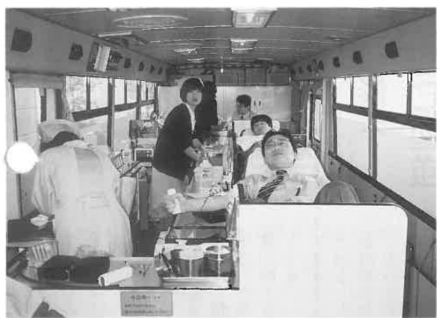
岡崎地区では賛助会員の(株)オリバー本社前に献血車を配して、多くの同社員の協力をいただいた

平日ながら多くの方の協力をいただけて、実績を上げることができた。また、献血キャンペーンを終えてから、今後より多くの協力を得るため、実施期間、企画などを考え話し合った。