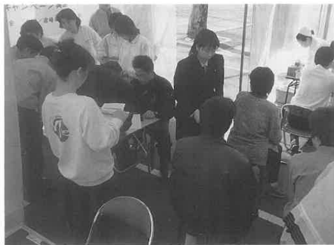
宮崎県ホテル協会の熱いご協力をいただき、宮崎レマンホテルの駐車場に献血車を配して実施

六日は献血車一台、七日は二台で対応した。二日間とも温暖な好天に恵まれたが、七日は強風にあおられ苦戦を強いられた。しかしサウナスロープメーカーの九州オリンピア工業のご厚意でお借りした大型遠赤外線ストーブが威力を発揮、寒さ知らずの中でキャンペーンとなり、目標を達成できた。