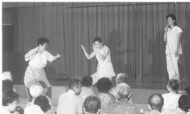
カラオケ交流会に声援がとび、おどろも加わって爆笑がわく

まだ残暑きびしい九月二十日の昼過ぎ、大阪市立弘済院養護老人ホーム(大阪府吹田市古江台)の施設の一つ、寿楽館の大広間に、大勢のお年寄りたちが集まり、ニュージャパン観光(大阪)の女性オペレーターさんたちがバスで到着するのを待っていた。