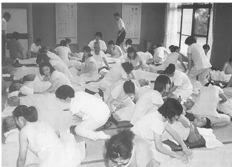
ふれあいを大切に交流、よもやま話に心もほぐれる

まだ残暑きびしい九月二十日の昼過ぎ、大阪市立弘済院養護老人ホーム(大阪府吹田市古江台)の施設の一つ、寿楽館の大広間に、大勢のお年寄りたちが集まり、ニュージャパン観光(大阪)の女性オペレーターさんたちがバスで到着するのを待っていた。