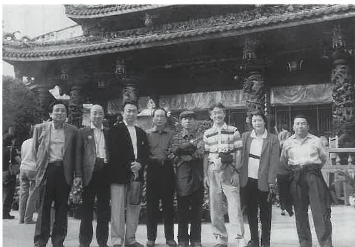
研修のあい間に台北龍山寺を散策

参加者はサウナMIYA ZAKI、温泉ぼうぼう、酒泉の杜、スーパ温泉元気湯の全店八名。 第1日目は台北空港着・市内観光後、サウナ入浴を行い、マッサージ、手足の爪切り、あかすりを体験する。マッサージ師はすべて男性。