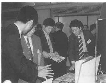
写真上はにぎわう会場の風景。同左右は展示商品の説明に人の輪が

全国オーナー会議で「サウナ関連商品等展示会」が併催され、賛助会員の二十社が二十一ブースを出展した。今回は講演とケーススタディの間に、特に午後四時から約一時間わたって、展示会の見学が行われ、会場は見学、実演、商談などにぎわった。