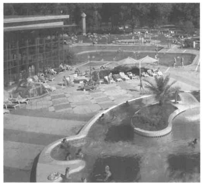
シュトゥット・ガルトのレジャープール

このように事業計画をしっかりとまとめて、作成しておけば、面接とか金融機関に行くと堂々と自分の考えていることが出せると思います。