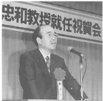
七月十九日、鹿児島市の城山観光ホテルで鄭先生の「就任祝賀会」が、前任教授で現在