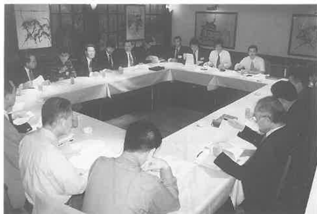
質疑応答も活発に情報交換が...

東京都サウナ協会は、七月十六日午後三時からパルバコアグリル(渋谷区神宮前)で勉強会を開催、会員、賛助会員など三十一名が参加した。