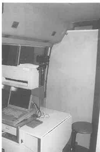
献血受付車の内部

ます。当協会の北海道支部の皆様は、特に献血活動に熱心に取り組んでいます。どうか一人でも多くの命を救うために、この車両を役立ててください。