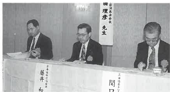
写真上は総会の模様。同左はご来賓