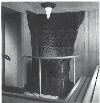
一步先を行くドイツのサウナ。

「ロッキー」は本体を岩石で囲い、ストーブの上にも石を乗せてフィンランド伝統のサウナ「リョウリュウ」(心地よい蒸気)を満喫できます。さらに燃料がガスのためランニングコストが電気代の半分で済みます。(特許出願中)