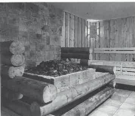
ストーブの上に石を積む本格派。