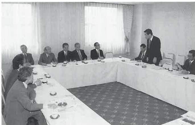
新年度の事業展開など審議

日本サウナ協会は「平成10年度第1回理事・評議員会」を五月二十一日、東京で開催。平成9年度事業報告、同収支決算報告をはじめ平成10年度事業計画の