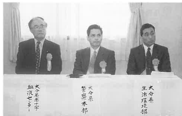
大分県生活環境部 大分県警察本部 大分県赤十字血液センター