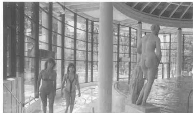
屋内外ともに季節を問わず楽しく利用できるカラカラ浴場

二十六日の総会での議事は、平成九年度事業報告、同収支決算報告、同監査報告、役員改選、平成十年度事業計画(案)、同収支予算(案)、その他。