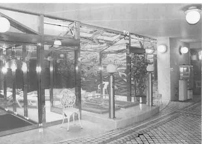
光がさし青空が映える吹き抜け。見るからに開放感がわいてくる

うこと、つまりお客さまを大事にすることにつながると思います」と話す。来店客は平日一日平均で百六十人〜百七十人といつたところ。客層はビジネスマン、自営業、それに農漁業の方など。また、「ラツキーへ行く」と目的をきめて車で三十分〜四十分かけてくる常連客が多い。最近では若