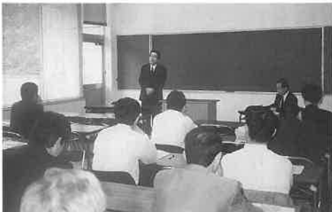
ことが報告された。続いて、全国総会、愛知県支部総会の会費と日程について検討された。全国総会

愛知県支部は「平成十年四月例会」を四月二十一日午後一時三十分から、東別院会館(名古屋市中区)で開催、三十四名(事務局二名)が出席した。(写真)