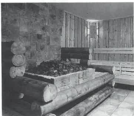
ストーブの上に石を積む本格派。

「ロツキ」は本体を岩石で囲い、ストーブの上にも石を乗せてフィンランド伝統のサウナ「リョウリュウ」(心地よい蒸気)を満喫できます。さらに燃料がガスのためランニングコストが電気代の半分で済みます。(特許出願中)