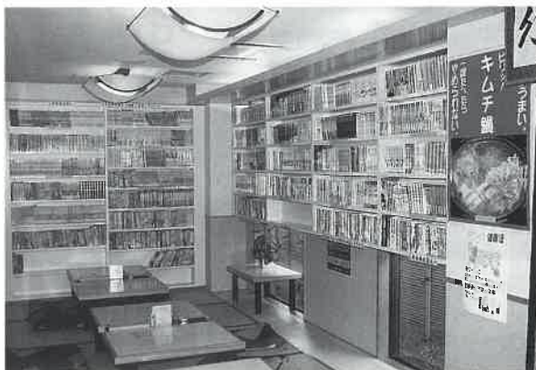
1階レストランの書棚にぎっしり並んだ漫画本