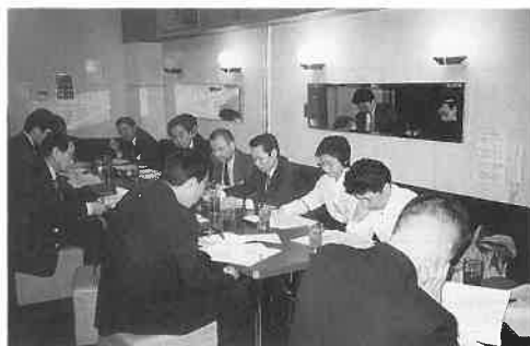
り、内容の検討を行った。全体的に入場客数が低調な中で、客単価がわずかな

行った宣伝やサービス内容について ③「入場客数」「売上」「新規顧客」等について、前年三月八日(土)との比較結果 ④「サウナの日」の広告の成果について ⑤来年以降の実施の必要性について ⑥今回の問題点、反省点について、等多岐にわたった。