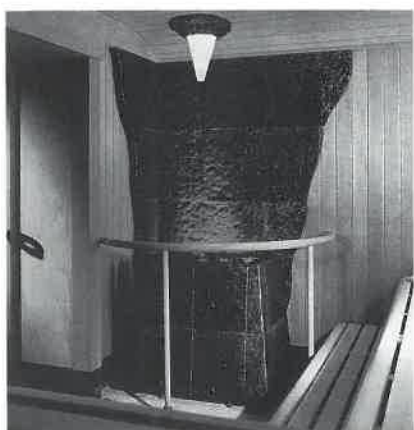
一步先を行くドイツのサウナ。

非日常性の追求 クラフスサウナ ドイツの温浴施設は「非日常性の追求」が根底にあります。サウナ室やストーブの意匠はもとより、施設設計コンセプトが夢の温浴施設(スパ)、感動と娯楽性を提供しているように見えます。当社は欧州の代表的サウナメーカー・クラフス社と提携し、夢のライフ・スパを提案致します。