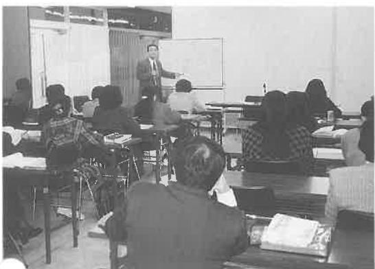
福岡会場での集中講義