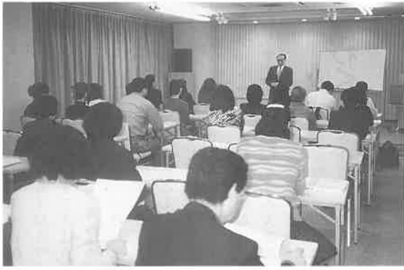
愛知会場での集中講義