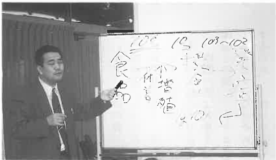
講師の福岡県田村主任技師