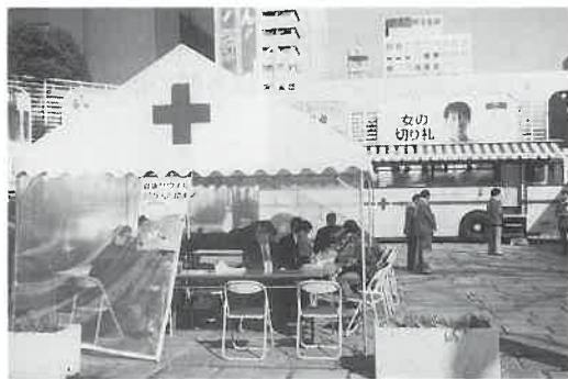
写真上は名古屋の栄広場(三越北側)で、同右は賛助会員(株)オリバーの本社で、同下は岐阜柳津ジャスコでの献血スナップ

サウナの日各店で企画! 一方、三月七日サウナの日の当日は、各店独自のプロモーション企画を行い、千円入泉(ウエルビー)、招待券プレゼント(日新観 光、千円優待券配布(東洋健康ランド、サウナフジ栄)、回数券半額販売(サウナベルヴェール)などが行われた。