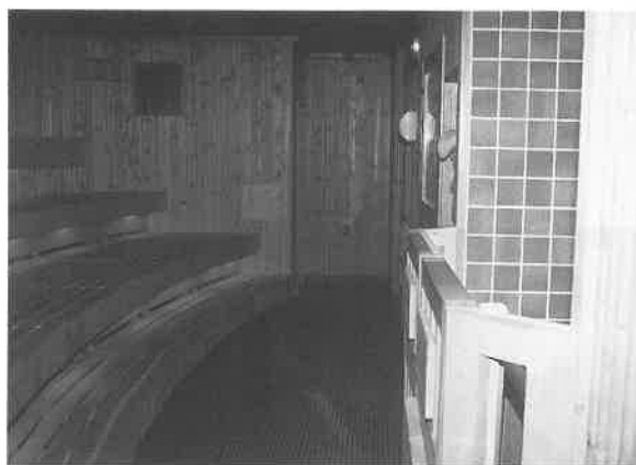
サウナ室。40分置きにリョウリュウを作り出す。

タターの...を保持している方がいる。日本でもサウナ協会がサウナ施設管理士という資格制度を始めたのですが、ああいう勉強を当然のようにやっているのです。