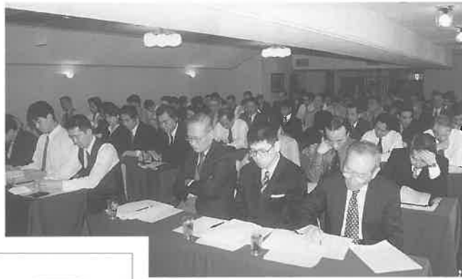
研修会場の盛況ぶり

今回はレディスサウナのお風呂の部分をリニューアルしたので、その経緯について説明し、わが社がどういうことを考えたかなど、お話し致します。