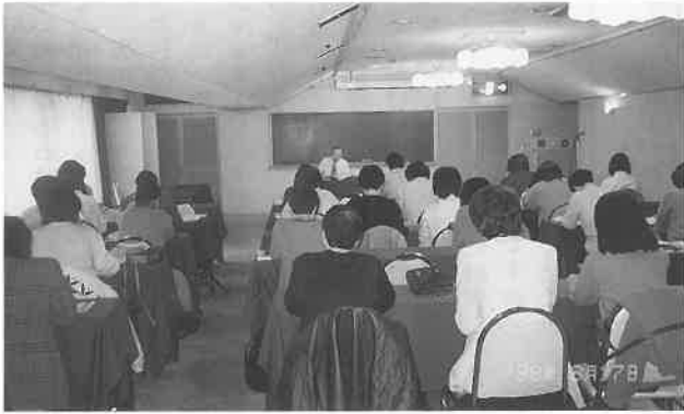
大阪会場での集中講義