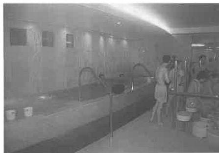
体験入浴中の大浴場