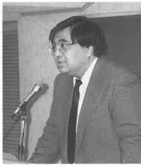
講師の大阪府・大城主査