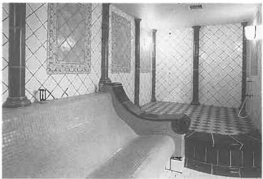
写真は横浜スカイスパ

サウナのなかったローマ時代のヨーロッパにあって、壁と床からの放射熱による温熱室(43℃～50℃)は温泉療法の重要な役目を果たしていました。当社はこの温熱室「テルマーレ」を理想的な意匠に仕上げ、夢のライフ・スパとして提案します。(写真は横浜スカイスパ)