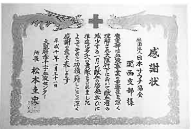
大阪府赤十字血液センター感謝状

うに展開するのか、一月に小委員会(座長・中野佳則副会長)で検討してきめた次の大要が提案がされた。当日は①「入浴料千円」のサービステートとする。②土曜日だが日にちを変更しな