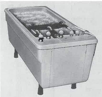
タラソバス「モンテカルロ」 欧州のテルメ、タラソ施設で好評。

気泡孔が二三〇ヶ所、五つのゾーンに分かれ、気泡が足から肩へと順々に移動します。海水の塩分を七〇%取り除いた有効成分(バスソルト)と海藻ミネラルが身体に浸透し、夢を見ているような満足感が得られます。(ドイツ製)