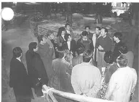
エバーランドで施設などの説明を受ける

最初に向かったのは、ソウル空港からバスで約九十分のところにある、総合レジャー施設エバーランドである。 この施設は、韓国第二位の財閥三星グループの三星エバーランド(株)の経営で、四百五十万坪の広大な敷地を有し、荒廃した山野の植林から始め、自然農園という名前で韓国内最初のレクリエーション施設として出発、現在は二十年を迎えエバーランドと名称を変え、フェスティバルワールド、カリビアンベイ、スピードウェイの三つのテーマに分かれており、現在の営業面積は全体の約一割の四十万坪である。