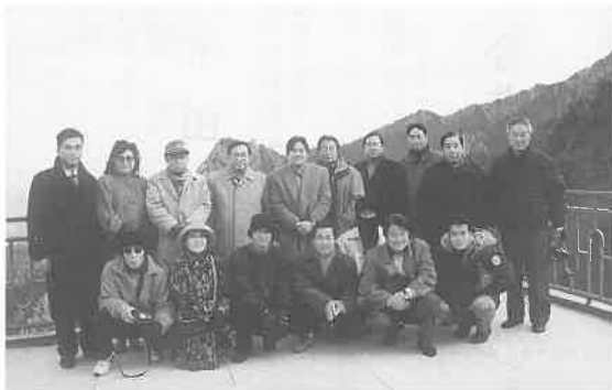
雄大な景観が展望できる雪嶽山で視察団20名が集合写真