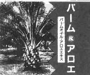
▲写真はマレーシア産バームヤシ