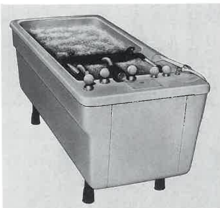
タラソバス「モンテカルロ」欧州のテルメ、タラソ施設で好評。

当社はこの温熱室「テルマーレ」を理想的な意匠に仕上げ、夢のライフ・スパとして提案します。(写真は横浜スカイスパ)