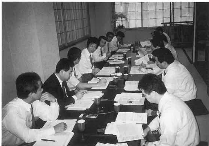
東京都支部の「店舗責任者勉強会」は7回目に。「サウナの日」のイベント、「知りたい情報」の交換や検討が活発に行われた。

よび賛助会員六社九名が出席した。今回は、前回と同じように体験入浴と施設見学を取り入れた。勉強会では――