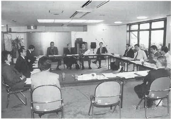
4月16日東京で開かれた平成9年度第1回理事会

(1)平成八年度事業報告案について四部会に沿って事業活動の内容の報告が行われた。次いで(2)同収支決算案について決算報告がされた。いずれも原案どおり承認され、六月三日に神奈川県横浜市で開催される通常総会(全国総会)に諮ることとした。 (3)今年九月〜十月に東京