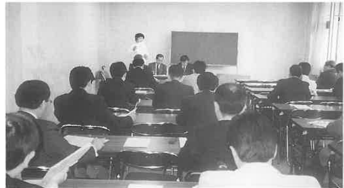
上は4月例会の会場風景。右はサッポロビール刀根支店長のあいさつ(右端)