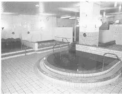
左から水風呂、超音波、白湯が並ぶ

考えています。多少の泥臭い面も必要ではないでしょうか。地下には一五〇名収容の宴会場、また三室あるカラオケルームでは、三〇名くらいの宴会、パーティースペースとして大変