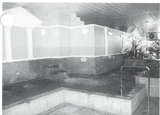
トトカの浴場を見わたす