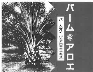
▲写真はマレーシア産バームヤシ