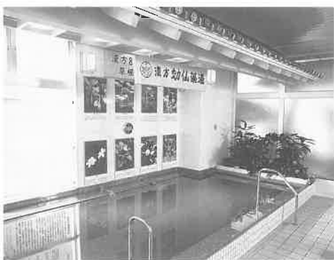
8種類の生薬を配した効仙薬湯

好評を得ています。年齢に関係なく、年配の方も若い方にも来て頂けるように考えた施設です。とにかく健康センターの楽しさの方をもっと大勢の方に知ってもらいたい」と語っている。営業は二十四時間、年中無休。入館料大人二千円、シルバー(六十五歳以上)千六百五十円、団体(十名以上)千六百五十円、時間帯により割引なども行っている。主な送迎バス運行駅は小田急線本厚木駅、JR平塚駅東口としている。