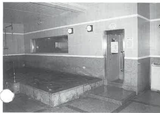
トトカのサウナ室、手前は水風呂