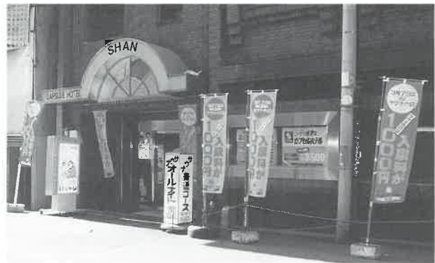
参加店の前に並ぶサウナの日ノボリ 大阪・淀川区のニューサウナシャン

三月は「3月7日サウナ健康の日」に合わせ、協会会員のボランティア活動による、春を彩る「全国献血キャンペーン」が展開されている。特に今回は日赤血液センターで献血された皆様に感謝して、全国で二十万人にサウナ招待券をプレゼントして、献血活動を促進しながら、健康サウナをアピールしている。