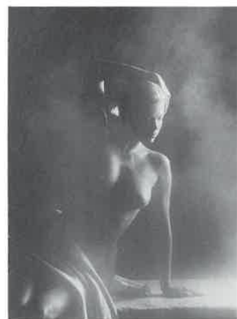
横浜・スカイバにて好評。

事前の広告に夕刊フジ三段広告、東京スポーツ、日経各社に各二段広告、マックジョイ(マクドナルド)に置かれている広告紙。関東ブロックで三十万部発行)二分の一ページ、パブリシティー広告二十五紙、その他ラジオ番組でサウナの効能などと含めたサウナの日をアピールした。当日の状況は、現在、集まっているデータを見ると去年の三月八日と比べた場合、入浴数で二四〇%、飲食料で二三〇%、マッサージ数一三八%、新規客数は二五〇(三〇〇%)といった数時も見られ、結果はほぼ満足の内容や反省点については次回の勉強会の課題とする。