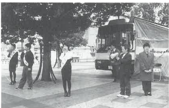
関西では3月7日10カ所で一斉に献血の呼びかけが行われた(ナンバで)