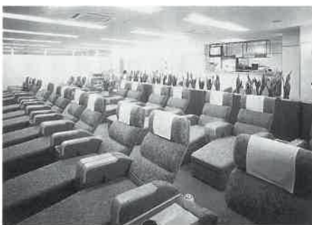
株式市況も見えるレストルーム

昨年末二十六日に竣工、当日と翌二十七日に合わせて三百人を招いて内覧会を行い、明けて一月六日から営業を開始している。