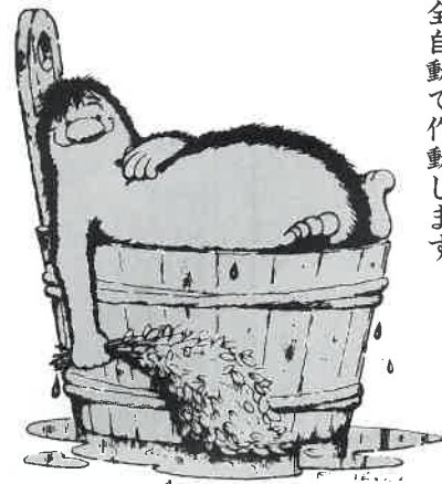
横浜スカイスパで好評。

一日の疲れを水中マッサージのジェットバスで体をいやす。浴槽は大・小各タイプあり、美しいデザインのアクリル製で、FRPに比べて艶光沢があり変色しにくい材質です。