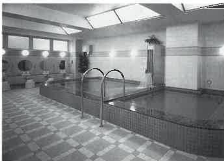
都市型では大きい浴槽を設ける

一階は貸し駐車場。二階がフロント、ロッカールーム(百十七個のロッカーを備えている)、大浴場。三階にレストルーム、マッサージルームがあり、四階がスタッフルームといった配置である。