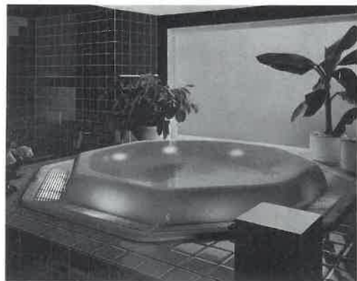
写真は水中照明を浴槽内と側溝にセットされています。サウナ・ホテル・エステティック・フィットネス施設に最適。

一日の疲れを水中マッサージのジェットバスで体をいやす。浴槽は大・小各タイプあり、美しいデザインのアクリル製で、FRPに比べて艶光沢があり変色しにくい材質です。