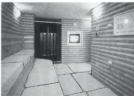
快適温度のゆったりサウナ室