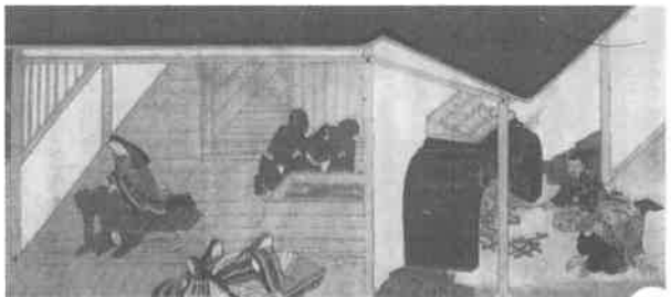
図2 湯屋で病者のあかをする光明皇后 「大仏縁起絵巻」(奈良・東大寺蔵)

のちほど、釈迦の説法の項で、入浴は毎月十四日、二十九日とあるのは、インド伝来の仏典に拠るところで、さきには中国、当時は唐、月一回の沐浴の勧め。中世の京都奈良では貴族や僧侶以外では石風呂