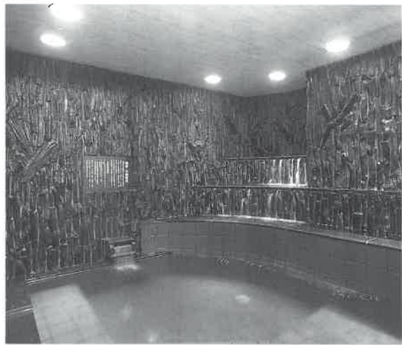
自然のエネルギーを感じる炭(すみ)風呂

浴槽のお湯は別に黒いわけでなく白湯と同じだが肌あたりがソフトでよく暖まる、それに脱臭効果も。かべに次のような効能書きが掲示されている。