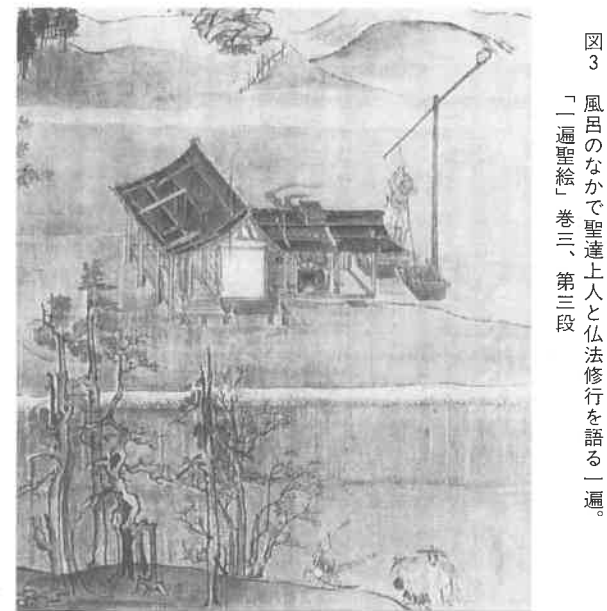
図3 風呂のなかで聖達上人と仏法修行を語る一遍 「一遍聖絵」巻三、第三段