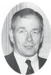
ベッカ・リントウ大使

一九一七年十二月六日にフィンランドがロシアから独立を宣言した日を記念し、本国では、毎年十二月六日には独立を記念し、大統領府をはじめ国をあげ