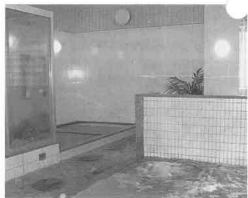
銭湯のノウハウが生きている大浴場

住宅街が広がる東京都杉並区西荻南で営業しているサウナ&レストラン「ユトリウム」は、地域の人たちの暮らしに密着した「まちのサウナ店」といった存在だ。今年九月、TBSテレビで放映された二時間ドラマ「サウナの玉三郎」(主演・小林稔侍)は同店で撮影された。コメディだが、その中で「サウナはこうでないかダメだ」とか「こうあってほしい」といった、かなり現実に近いところで面白おかしく演じられていた。視聴率も高く、同店のお客様の間で大きな話題になった。