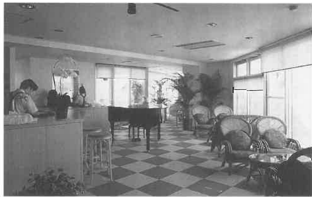
ピアノが置かれコンサート会場にもなるレストラン