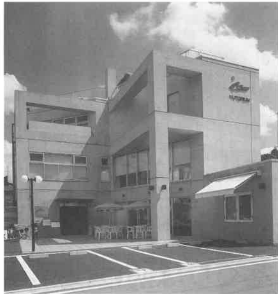
モルタル打ち放しのモダンな建物の外観