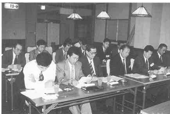
営業成績を基に活発な議論が行われた。

研修会終了後の懇親会は三社五名の賛助会員を交えて盛大に行われた。ここでも研修会で聞けなかった部分などに、さらに詳しく意見を交換されていた。