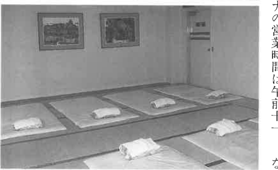
写真上は浴場、手前がサウナ室。下はサウナ客専用のマッサージ室