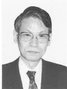
日本赤十字社事業局血液事業部長