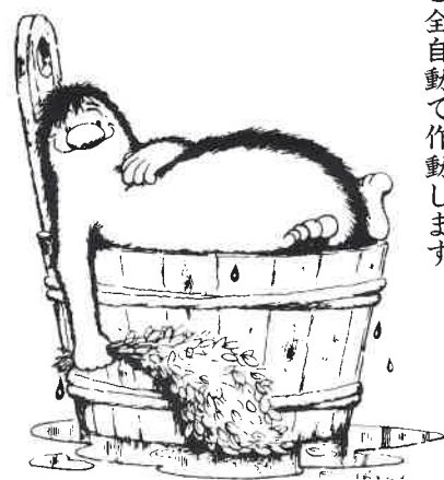
集客力アップにご検討ください。

温度と湿度の心地よいハーモニーをフィンランド人は「リョウリュウ」と呼んでいます。サウナづくり30年の経験を生かして、お望みの温度と湿度をセットすれば、この「リョウリュウ」を満喫できます。例えば温度80℃と湿度10%、70℃と20%...と全自動で作動します。