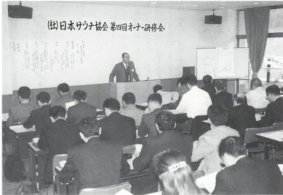
(社)日本サウナ協会 第四回オナー研修会