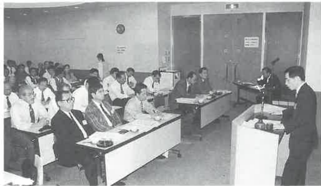
▲分科会 A グループ(シティサウナ)