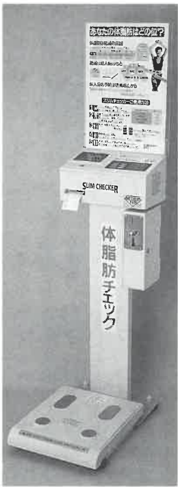
スリム チェッカー-2 最新低価格機登場

一九六三年三重県生まれ。雑誌 編集者を経てフリーに。「大人 モノ」を中心に活躍。雑誌連載 多数。著書は「大人養成講座」 「大人の女養成講座」(扶桑社) 「ニッポンこりやあ、どうす りやい」んだ事典」(東洋経済 新報社)など。