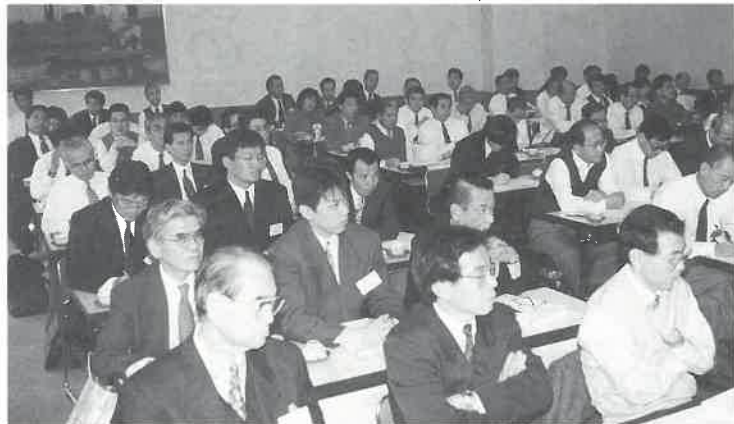
▼講演に集中して聴き入る参加者