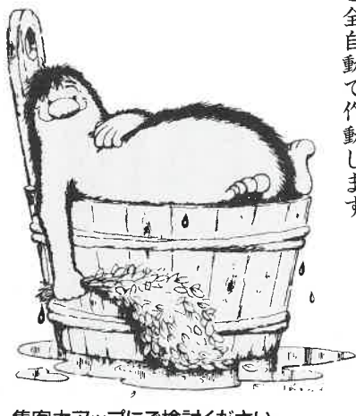
集客力アップにご検討ください。

温度と湿度の心地よいハーモニーをフィンラ ンド人は「リヨウリュウ」と呼んでいます。 サウナづくり30年の経験を生かして、お望み の温度と湿度をセットすれば、この「リヨウ リュウ」を満喫できます。 例えば温度80℃と湿度10%、70℃と20%... と全自動で作動します。