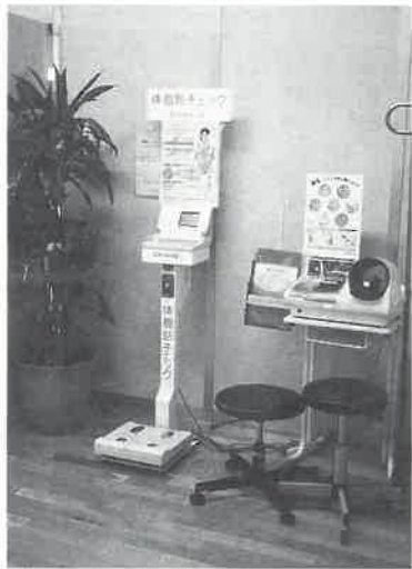
健康で呼ぶ 深谷センター 人気を呼ぶ 嵐山

たこの測定器は場所をとら ないスリムな一体型で、体 重計のとなりに並べて置く こともできる。 現在、体脂肪計の需要が 各方面から大幅に拡大して いるところから、(株)プレ ジャーでは、サウナ業界への 普及に合わせて低価格機種 の「スリムチェッカー-2」 をこの11月から発売を開始 した。本体価格はプリンタ ー無しが39万8千円より (プリンター・コインボッ クス別売)とさらに収益性 が高まり、その人気とともに にサウナ施設での集客アッ プに、そして、お客様への 健康管理に大いに役立つも のと期待される。