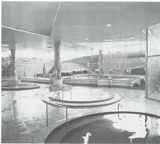
「湯あそびひろば」(浴場)の全景

東京都多摩市の玄関、京王線・小田急線へ永山駅・北口への目の前にある「永山健康ランド」が、二か月休館してリニューアルを行い、去る七月二十七日から