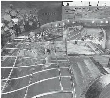
温浴ストレッチができるダングラー

装いも新たに再オープンしている。同店が新規オープンからわずか二年五か月でリニューアルにふみきつたのは集客力アップがねらい。これにより大きく様変わりしたのが、浴場施設である。従来は、お客様にのんびり、温泉気分を楽しんでいたただくことを考えて、大流水風呂をメインにサウナ、岩風呂、檜風呂、イベント湯などを設けていた。しかし、