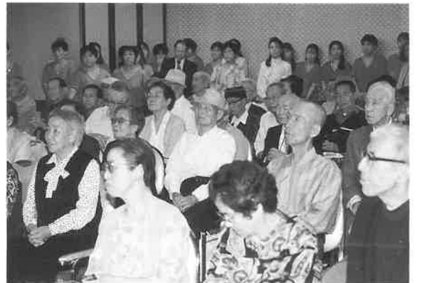
お風呂あがり、カラオケ競演を楽しむ

ーターさんたちは『敬老の日』に合わせて、毎年、同院のお年寄りを慰問している。それも、オペレーター