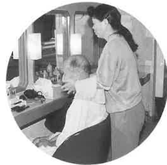
スキンケアでさっぱり

九月二十日、正午すぎに、前、大阪・道頓堀のニュージャパン観光(株)サウナ店の玄関に、トレーナー姿の大勢のオペレーターさんが集まり、大阪市立弘済院養護老人ホーム(吹田市古江台六)のお年寄りたちを「いらっしゃい、お待ちしてました」と笑顔で出迎えた。ニュージャパンのオペレ