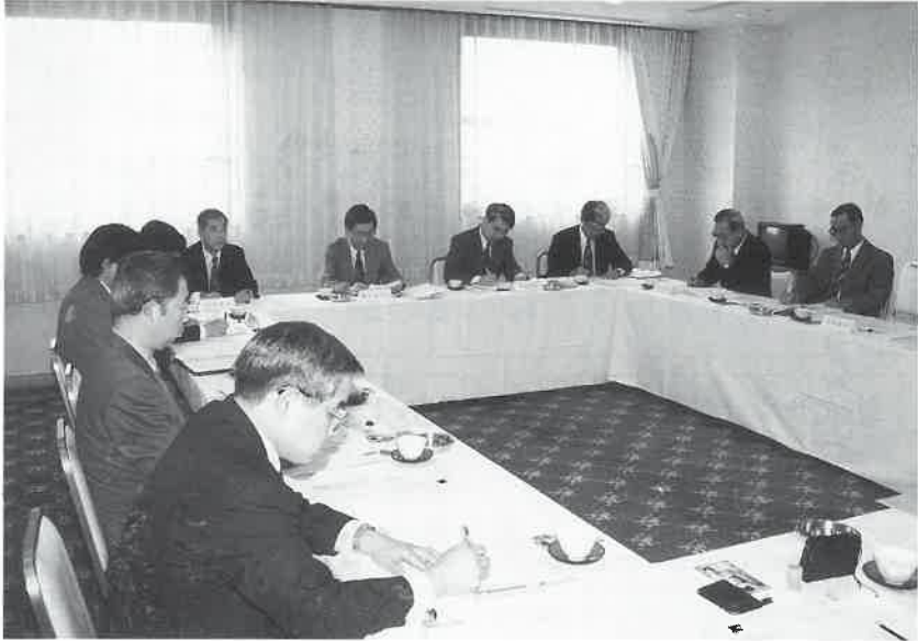
13名の委員が集まった初会合