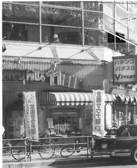
全国サウナ祭ののぼりがお客様をまねく

十日に一度の方が、サウナ祭になると、たびたび来られるというように、お客様は(サウナ祭を)よくご存じですよ」という。