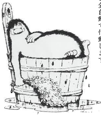
集客力アップにご検討ください。

温度と湿度の心地よいハーモニーをフィンランド人は「リョウリュウ」と呼んでいます。サウナづくり30年の経験を生かして、お望みの温度と湿度をセットすれば、この「リョウリュウ」を満喫できます。例えば温度80℃と湿度10%、70℃と20%...と全自動で作動します。