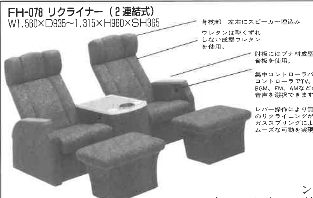
FH-078 リクライナー(2連結式) W1,560×D935~1,315×H960×SH365

レストルームは健康・レジャー施設のグレードを決める重要なアイテムのひとつ。ですから細部には断然こだわりたいもの。たとえばレストルームでTVを見る場合、場所によってはモニターの音が聞えなかったり、逆に音が大きすぎたりすることがあります。これではせっかくのくつろいだ気分も半減してしまいます。そこで弊社ではNewデザインのリクライナーチェアにスピーカーコントロールユニットをシステムアップしお好みの音量でリスニング。もちろんお手元のコントロールローラーで、お好きな音声を選択することもできます。