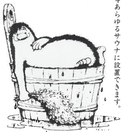
集客力アップにご検討ください。

激流 シエイプ・ウェイブ 秒速3.8mの強力水流。ジェット・ノズル式より強く、激しくボディーを直撃します。エステティック・ホテル・サウナ・スポーツ施設・厚生施設向けに最適。(リコー精器製)