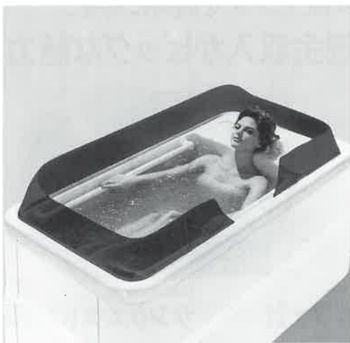
厚生省承認医療機器

また、子供には「ちびっ子サイクルロード」や「迷路」といった遊びのスペースを設けている。