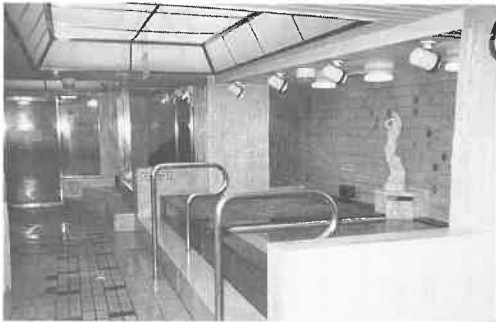
整理整頓の行き届いた浴場

家庭では体験できないサウナや、さまざまなお風呂のバリエーションを楽しんで気分爽快、満足顔の顧客が洗い場に腰を下ろしたと