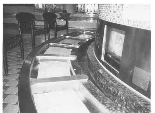
足浴槽。オーバーフローで湯を浄化している。

『スパープラザのリニューアルを大解剖』—これからのサウナとして何を目指したか。こんな課題で六月十九日、ニュージャパン観光・道頓堀ビル(大阪中央区)で開催された関西サウナ協会主催「第六回幹部研修会」は、関西のいつものメンバーに加えて京滋、四国、岡山からも参加があり、総員七十名を超える盛況ぶり。これは、従来の研修会のほぼ四倍にあたる参加数で、課題に対する関心がそれだけ高いことを示すものといえよう。