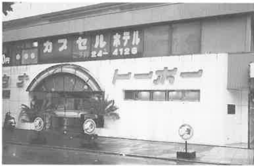
サウナト－ホ－の外観