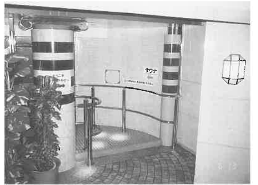
入場口の足洗い。感知して自動的に温水が出る