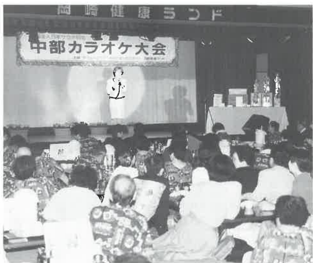
写真は、昨年11月27日、岡崎健康ランド(岡崎市)で開催された「第1回中部カラオケ大会決勝大会」の盛況ぶり。いま第2回の栄冠をめざして参加店で予選が行われている。

平成七年度全国オーナー研修会は、ハード面、ソフト面、飲食、方向性、などのテーマで実施し、会場は最近オープンする施設を検討中。企画、開催地など事業部会、組織部会に一任することです承された。