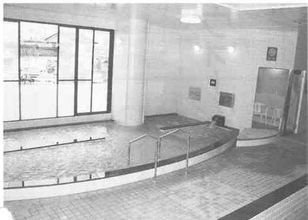
バイブラス、ジェットバスが並ぶ