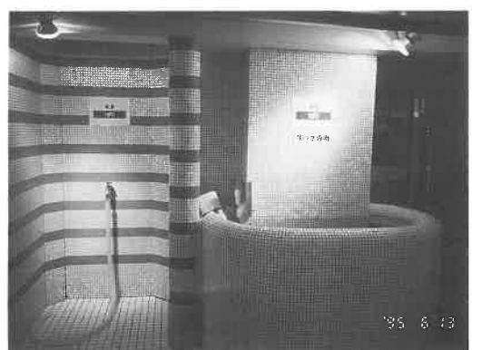
冷却コーナー。溜め水、ホースなどを整備