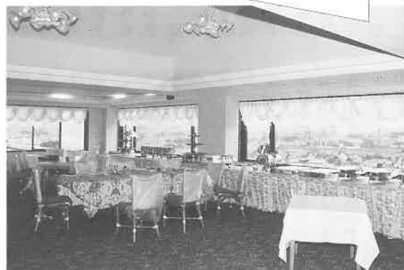
10階の大展望レストラン

いう、ちよつと珍しい二重構造になっている。お好みでどちらでも、あるいは、低温で少しづつ体をなれさせてから高温へといった利用ができる。サウナ浴後の水風呂はもちろん、クイール浴(マイナス九度)もある。このほか、韓国式あかすり、エステティック(女性のみ)も。