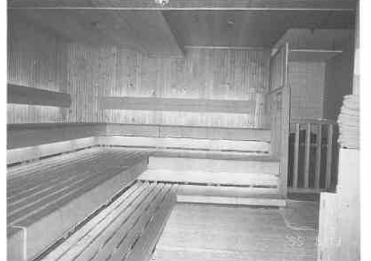
中温サウナ室。マイルドな熱が独特