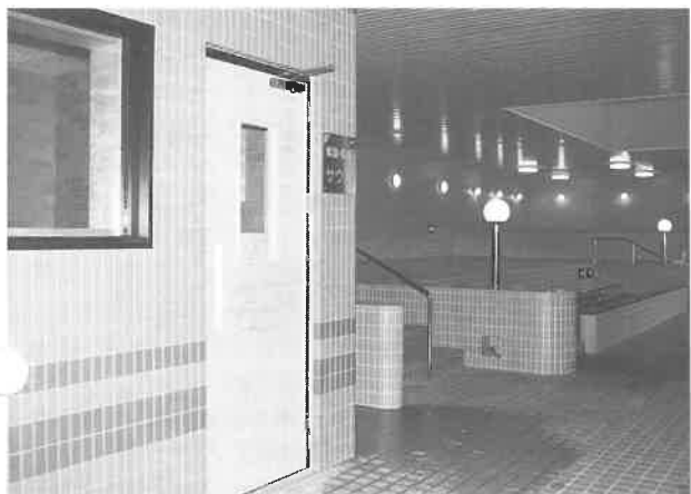
手前は高・低温サウナ室、向こうはプール風呂

建物は十階建て延べ床面積約八千九百五十平方メートル。駐車場四百台分。一、二階がレジャール施設、三、九階