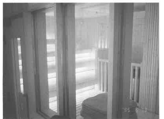
高温サウナ室。中温サウナと印象は変わらないが、入っていると温度差がわかる