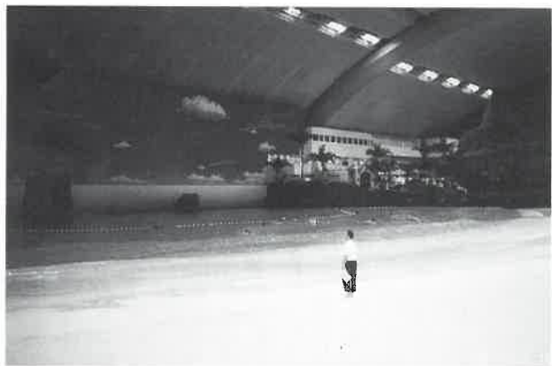
常夏の浜オーシャンドーム内部

・観光バスで半日コース、日帰りコースの3コース(有料)を準備 ・ゴルフはフェニックス・カントリークラブ(7組)を用意