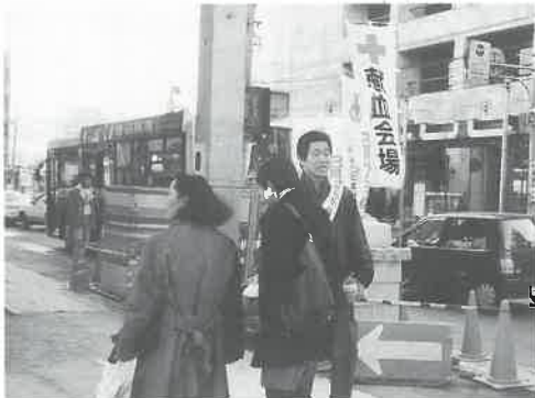
▲岐阜・キャッスルホテル前で