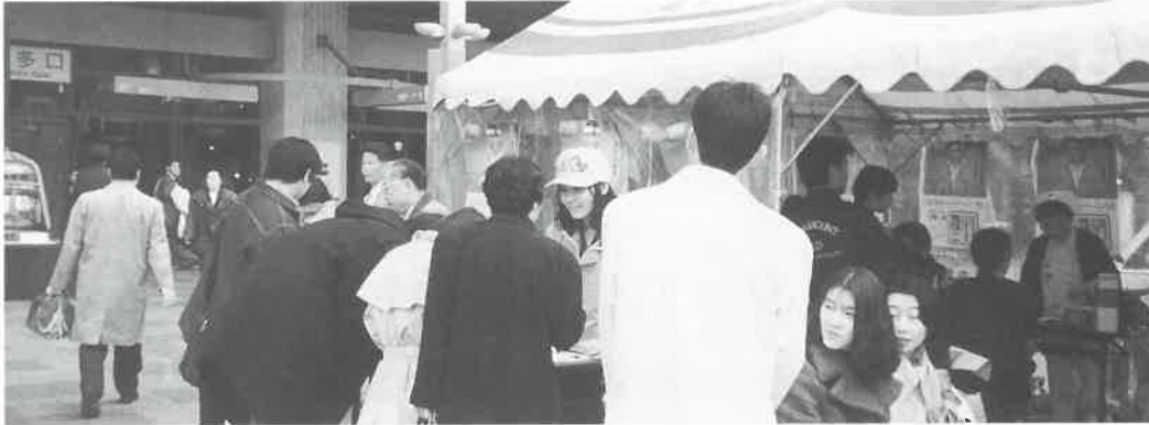
▲JR博多駅前での呼びかけ