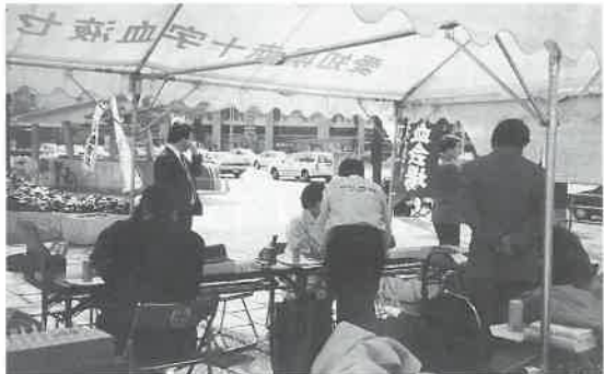
▼名古屋・三越北側の栄広場で