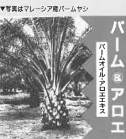
パーム&アロエ パームオイルアロエエキス