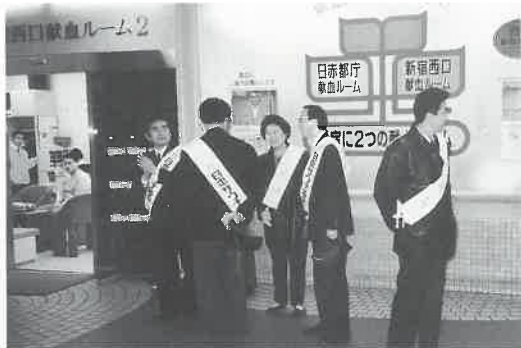
東京・新宿西口の献血ルーム前で