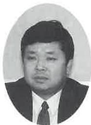
厚生省生活衛生局指導課長