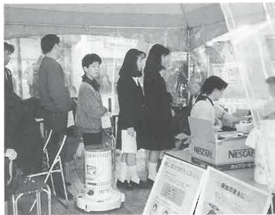
▲北九州市・黒崎名店街で