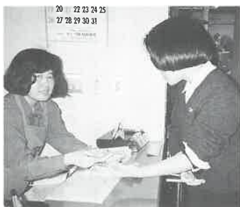
▲四国・高松の繁華街で

宮崎県協会では、3月7日サウナ健康の日宮崎市京塚、宮崎レマンホテル駐車場、同恒久の赤十字血液センター、同若草通りの献血ルームで、献血にご協力いただいた方々にサウナ招待券(1400枚)をさしあげた。