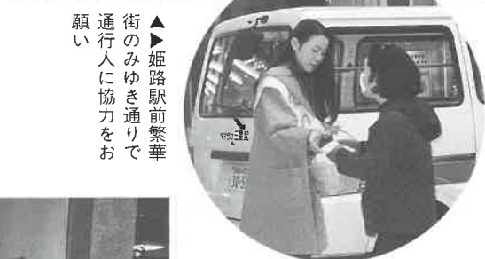
▲姫路駅前繁華街のみゆき通りで 通行人に協力をお願い