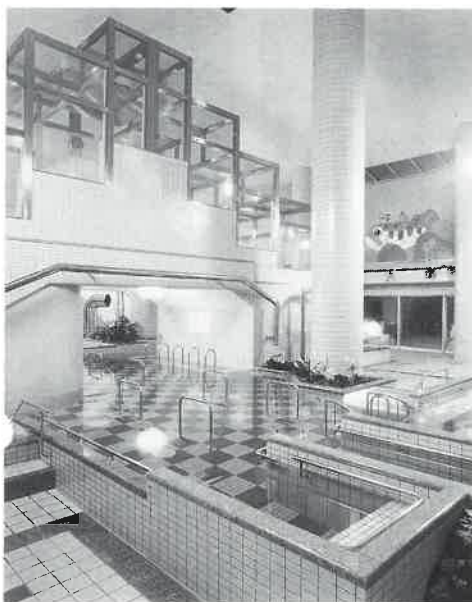
パーテゾーンの中にある「クリスタル採暖サウナ」(写真上部)。冷えた体を暖めるサウナ風の部屋。室温60~70度と、低温サウナより一段低い温度に設定されている。