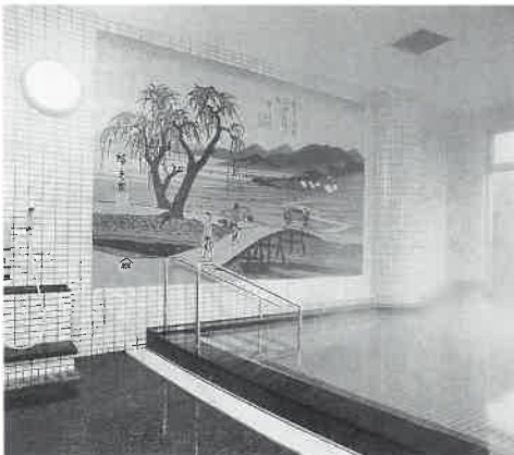
男性大浴場(写真)には安藤広重の木曾街道六十九次「落合川」をモチーフにした壁面。女性大浴場には同「中津川」が目をはく。

そこで、現在、隣接地に今年八月オープンをめざして、和室を主にした温泉旅館を建設中。また、パターゴルフ場、テニスコートもつくる計画である。