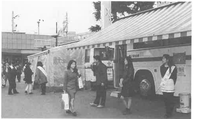
大阪・JR大阪駅前前で献血を呼びかける。阪神大震災の被災者を思いやり若い人が積極的に献血