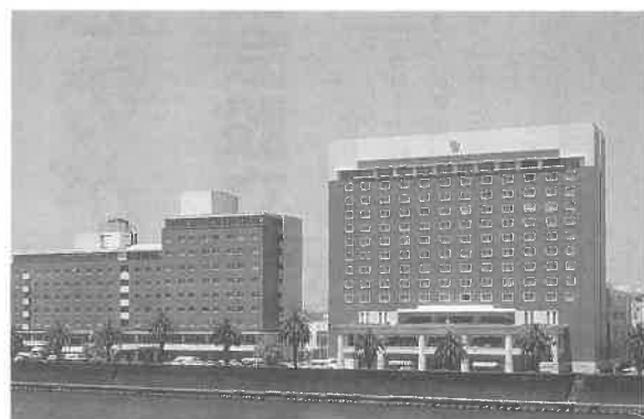
全国総会の会場となる宮崎観光ホテルの全景

宮崎県支部では、一人でも多く総会に参加できるように、参加登録料は宿泊・懇親会込みで一人三万二千円、総会のみ参加は一人二万二千円を考えている。また、現在、航空券の特別割引を旅行社、航空会社と交渉中で、かなりの割引率になる模様だ。