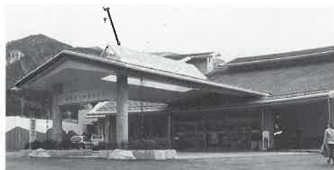
温泉健康館の玄関と建物の外観。

千余平方メートルに及ぶ。ロッカー数九百二十個である。建設費は周辺整備をふくめ約三十四億円を要した。