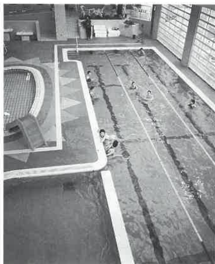
パーテゾーンの室内温水プール。ほかに子供プール、屋外流水プールがある。

その後、平成四年、六年度にかけて三か年計画で健康温泉館の建設が進められた。市が初めて手掛ける大型健康保養施設であり、当初から小林市長は「公務員の間ではむづかしい部分もあるが、民間のノウハウを拝借しながら市民の健康充実、保養、新たな活力づくりの場になるようにし