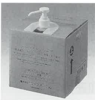
ハーブボディソープ