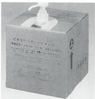
ハーブリンスインシャンプー