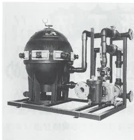
ステライト濾過機

世界最大の濾過機メーカー！米国ステライト社。先進的技術とコストダウンにより、今、世界で最も人気のある濾過機です。砂濾過とカートリッジ式の両タイプ揃えており、湯水・プール・浴槽など幅広い分野でご利用いただけます。