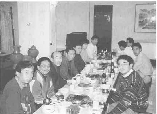
南山公園タワー下で、この季節がもっともおいしい焼肉料理を味わうツアーの一行