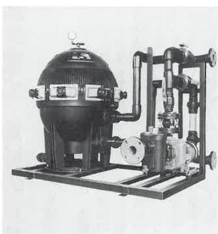
ステライト濾過機

世界最大の濾過機メーカー・米国ステライト社。先進的技術とコストダウンにより、今、世界で最も人気のある濾過機です。砂濾過とカートリッジ式の両タイプ揃えており、湯水・プール・浴槽など幅広い分野でご利用いただけます。