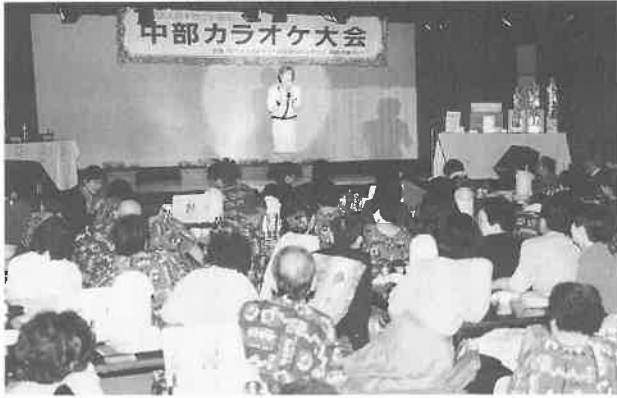
拍手と声援がわく決勝会場

この日、会場の大広間にはひるすぎから決勝大会を 見よう、応援しようと思 いに陣取った大勢のお客 様で埋った。出場者二十名 は余裕を持って会場に早々 と顔をそろえた。この共同 企画に参加した協会会員の 岡崎健康ランド(岡崎)、東洋 健康ランド(岐阜市六条江 東)、バーデンバーデン(浜 松市菅原町)、湯とびあ 宝(名古屋南区前浜通り)、 豊橋健康ランド(豊橋市神 野新田町)、宴遊ランドト ーラス(名古屋緑区鳴海 町)の各店で予選、選抜を 勝ち抜いてきた方ばかりと あって、各店から付き添い の人たちが、また、それぞ れの家族や友人、グループ などの応援団も駆けつけて、