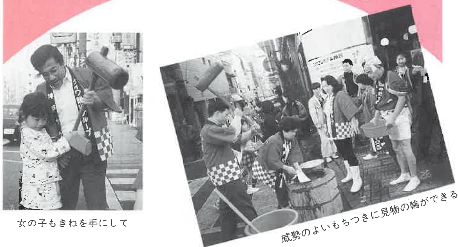
女の子もきねを手にして

本格的な冬の訪れを前に十一月二十六日、師走の行事には一足早い「もちつき大会」が神戸サウナ(米田利勝社長、神戸市中央区下山手通)で行われた。つき上がったおちは通行人にふるまわれ、集まって来た子供たちも大喜びでほおばっていた。