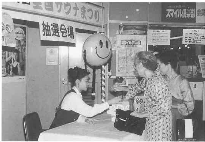
長寿村の抽選会場

健康ランド長寿村(奈良県橿原市曾我町二〇)では八日から十八日まで「開業8周年わいわい大感謝祭」を開催、これと重なる形で「全国サウナ祭」を十一日