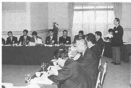
分科会Aグループ・健康ランド