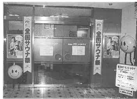
楽天地グランドサウナの入口

都内で八店舗を営業している泉興業(本社東京都墨田区江東橋四)では、ホランドサウナの三店舗で全国サウナ祭を実施。期間は月のうち中だるみが出てくる十日から二十日まで十一日間とした。