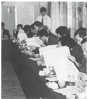
分科会Bグループ・都市型サウナ