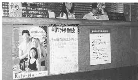
あま湯ハウスのフロントでの掲示

あま湯ハウス(兵庫県尼崎市長洲西通一)は、昨年十一月に協会に加盟したので、全国サウナ祭は今回が初参加である。開催期間は一日から十四日までと設定