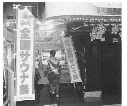
サウナハワイの華やかな入り口

Wチャンス賞も、当たりを多くという考えで、七〇点ミニシャンペン・リンスのセット、一〇〇点くつ下かパスト、一五〇点テレカか当店の半額入浴券、二〇〇点で同無料入浴券といった設定。レディースは常連客が多く自然にWチャンスのポイントが集まるので、くつ下やパストなど消耗品が喜ばれた。