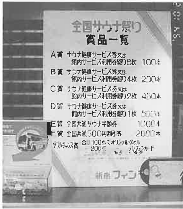
新宿・フィンランドでの掲示

サウナ祭の期間中は、お客様に細かい説明ができるように従業員には指示を徹底し、祭りと案内状の効果でおお客様の動員は十分できたので、「ほぼ満足できる状況です(店長)」というにぎわいだった。