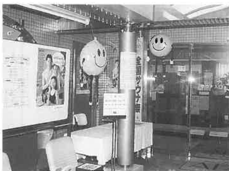
マスコットが出迎えるアピア入口

「マッサージ率が高いので館内ご利用券はそうしたお客様にも好評です。またリピート客が多い方なので何度も来たいお客様に招待券が喜ばれています(副支配人)ということである。